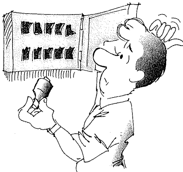
Automsäkringar. Inga proppar behövs.

Elmätarna och huvudsäkringarna är placerade i ett elskåp i källaren. Kontakta fastighetsförvaltningen om Du önskar läsa av Din mätarställning.