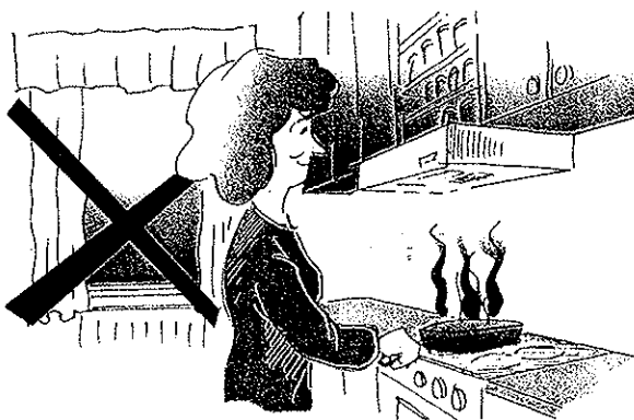
Vädra inte i köket när Du lagar mat.

Öppna inte köksfönstret. Gör Du det sprids matoset i hela lägenheten. Luften som kommer in genom fönstret gör att det bildas ett övertryck i köket. I och med det drivs luft och mat-os ut i resten av lägenheten. Inte ens spisfläkten kan suga upp matoset om fönstret är öppet i köket därför att luftcirkulationen runt fläkten störs. Öppna fönstret i angränsande rum istället, och ha dörren till köket stängd. Gör Du så blir det undertryck i köket i förhållande till resten av lägenheten. Det betyder att luften från det öppna fönstret i det angränsande rummet kommer att sugas ut i köket och det hindrar matos från att tränga ut från köket.